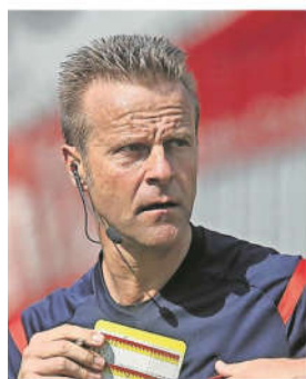
Über 15 Jahre lang pfiff er Bundesligaspiele: Schiedsrichter Peter Gagelmann.

Haupttalkgast ist Bremens ehemaliger Bundesliga-Schiedsrichter Peter Gagelmann. Über 15 Jahre lang pfiff er Spiele in Deutschlands höchster Klasse, aber auch in Südkorea und Saudi-Arabien war Gagelmann im Einsatz. Seit 2015 ist er als Sky-